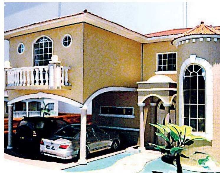
Uno de los modelos a escala que se exhiben en la feria.

• La organización petrolera y Agencia Internacional de la Energía, entre otras entidades, coinciden en que la demanda de crudo mermará este año.