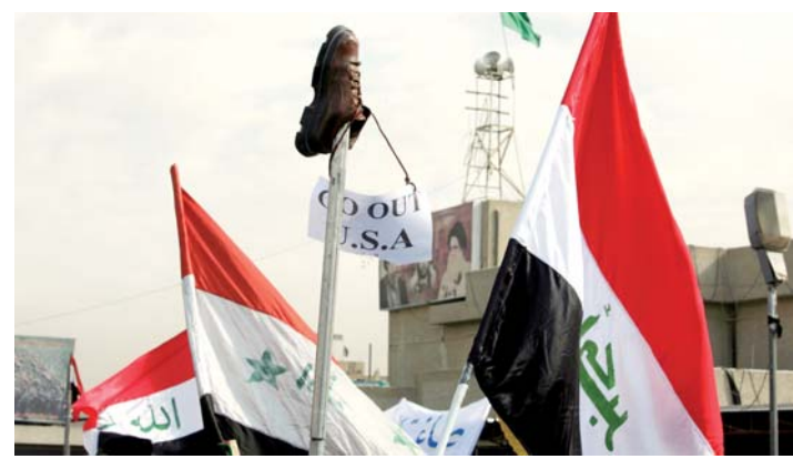
El zapato figuró ayer junto a la bandera nacional como símbolo iraquí.