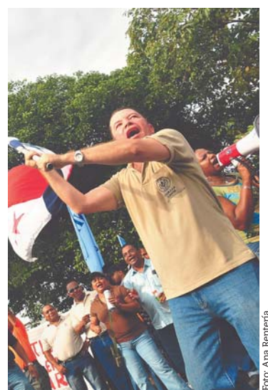
Los funcionarios mantienen la presión.

Sin embargo, advirtió que ir "más allá" de esta oferta compromete las finanzas de la CSS. Antes de terminar, Carrasquilla completó el dúo de contradicciones al afirmar que "las