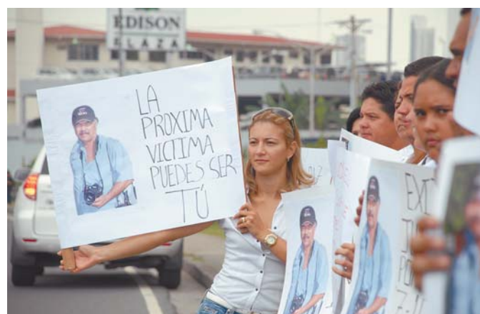
Vestidos de blanco, parientes pedían que no quedara impune el crimen.

IRLANDA SOTILLO isotillo@laestrella.com.pa