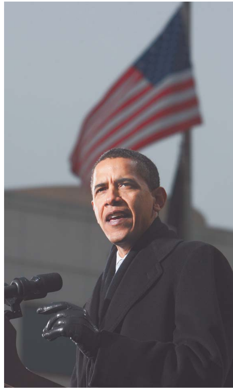
Barack Obama se convierte hoy, en el presidente número 44 de los EEUU, en medio de una expectativa mundial.

Pero, por encima de todo, celebran en Estados Unidos, el país que luchó por la libertad mientras defendía la esclavitud. Celebran porque han cerrado un círculo, el que se inició cuan-