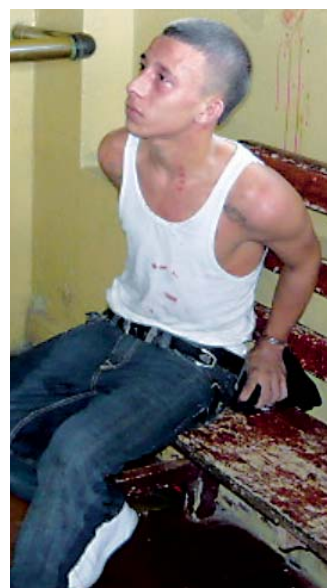
Uno de los detenidos en Colón.

En Colón, varios sujetos, entre ellos un ex policía, intentaron robar en una casa, pero fueron capturados en un retén. +4A