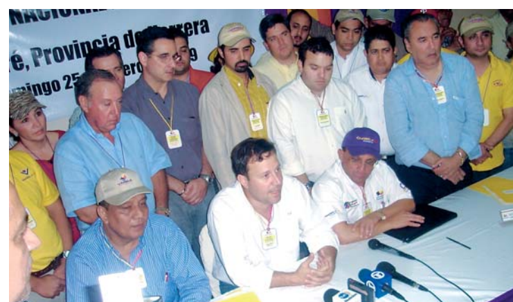
Tras siete horas de discusión, el directorio decidió dejar todo para la convención.

Fueron siete horas de discusión. Al final se decidió aprobar todo el proceso para que el 31 de enero en la convención