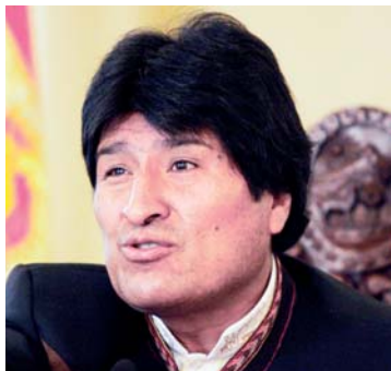
Presidente Evo Morales

Aún así, el panorama no es ideal. La media luna autonomista continúa empecinada en no acatar el nuevo documento, y Evo tendrá que sudar para unificar al pueblo boliviano.