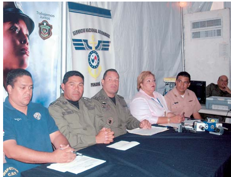
Los estamentos de seguridad rindieron un informe del Carnaval.