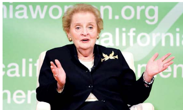
¿Cuánta influencia tendrá Albright en las políticas de Obama?

Ahora, el fiscal intenta descifrar la identidad de "El Españolito lanzalatas", esto permitiría determinar también si está inscrito en algún partido político. +5A