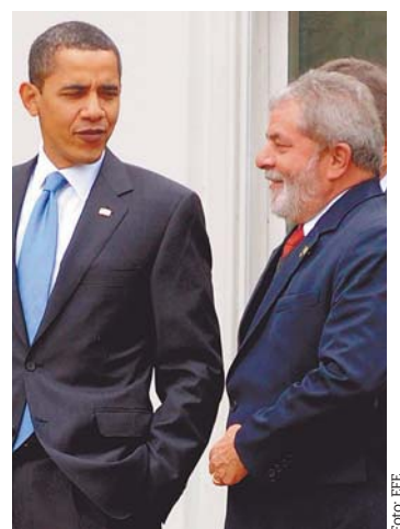
Los presidentes Obama y Lula.

Aunque Obama no especificó países, dijo que Brasil será su conexión para “fortalecer” su relación con América Latina. Además, elogió la energía renovable brasileña. + 6C