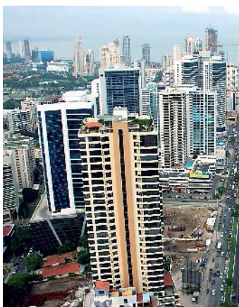
Panamá deja de ser competitivo.

Con esta elevada cantidad, los familiares directos del inversionista podrán laborar dentro de la empresa sólo si invierten una cifra similar. Analistas y empresarios con-