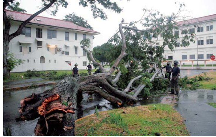
Cerca del Teatro Ascanio Arosemena en Balboa varios árboles cayeron.