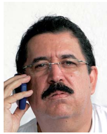
Manuel Zelaya, presidente depuesto.

En Panamá, el presidente Torrijos mostró su “solida-