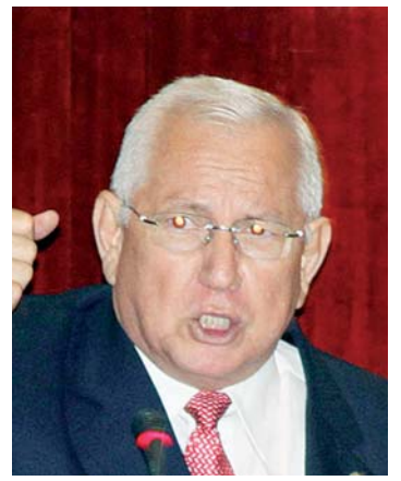
Roberto Micheletti, asumió el poder.

ridad y respaldo a Zelaya”, mientras que el presidente electo, Ricardo Martinelli