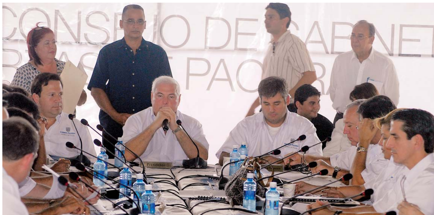
Primer Consejo de Gabinete de la era Martinelli realizado en el centro recreativo Vielka Lorena, ubicado en el corregimiento de Pacora.

una partida de $750 mil y la integrarán un financista, dos ingenieros y dos abogados.