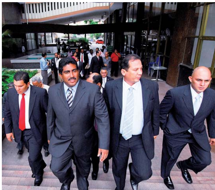
Los concejales del PRD a su llegada al Hatillo.

PANAMÁ. Manuel Zelaya, presidente derrocado de Honduras, partió ayer de Panamá seguro de su retorno a su país. Manifiesta tener "una estrategia junto a sus aliados". El político arribó poco después a El Salvador. +2A