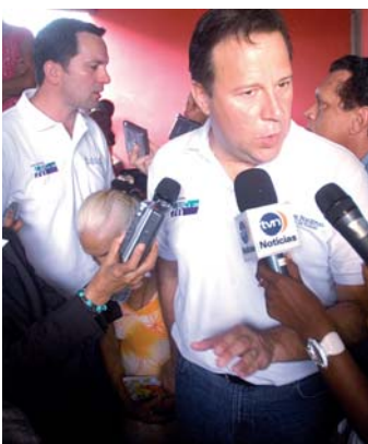
Juan Carlos Varela

Varela puso de manifiesto la disposición del gobierno panameño de interponer los mejores oficios para que la mediación del presidente de Costa Rica, Oscar Arias en el conflicto hondureño sea todo un éxito.