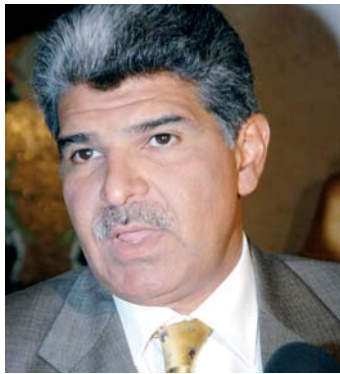
José Raúl Mulino