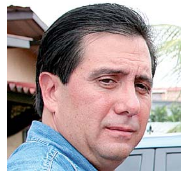
Martín Torrijos Espino