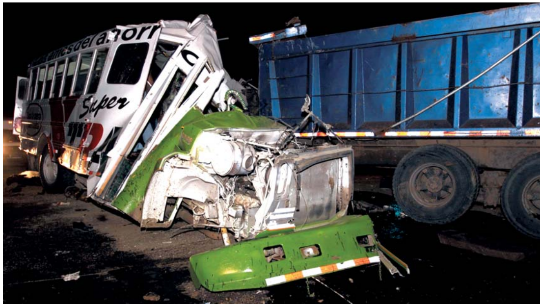
El volquete impactó de frente al bus que se disponía a girar hacia Las Garzas.

Al instante murieron 22 personas. Otras 23 heridas llegaron a la Caja de Seguro Social (CSS) y al Hospital Santo To-