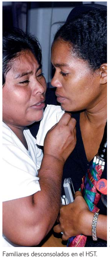
Familiares desconsolados en el HST.

más, (HST) dos de ellas fallecieron más tarde, el listado de muertos alcanzó 24 personas.