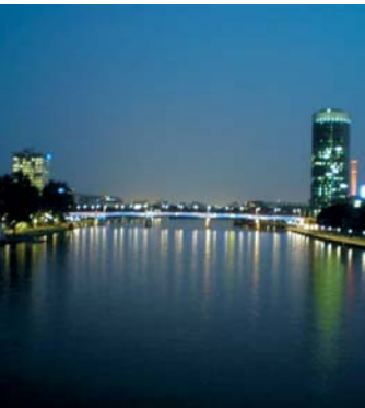
Frankfort centro comercial alemán.

PARIS. No se sabe con certeza si se trata de una recuperación definitiva o un optimismo pasajero, lo cierto es que después de un año en rojo, Alemania y Francia salieron de la recesión en el segundo trimestre del año, aunque no consiguieron empujar, con ellas, al conjunto