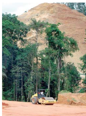
Petaquilla es viable económicamente.

Un análisis de The Nature Conservancy (TNC) asegura que la actividad generaría importantes ingresos económicos que serían de mayor beneficio si se reparten equitativamente.