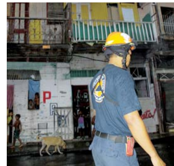
Caserón afectado en Santa Ana.

Voladuras de techos, deslizamientos, viviendas destruidas, caídas de árboles son algunos de los daños. No hubo víctimas fatales. +2A