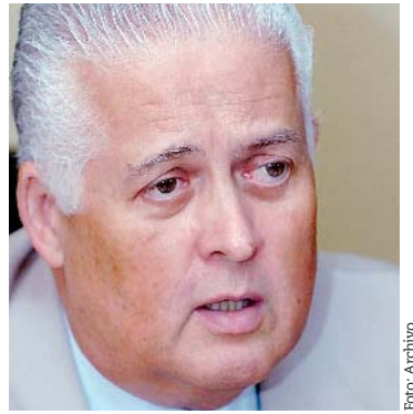
Ernesto Pérez Balladares.

Incluso el ex presidente de la República, Ernesto Pérez Balladares está dispuesto a un diálogo. "Si hay que construir puentes para reestructurar el partido estoy dispuesto a hacerlo", dijo. +4A