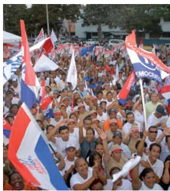
El PRD sobrepasa 600 mil miembros.

El sábado durante una reunión en Coronado, un grupo propuso ocupar al menos 5 de los 9 puestos dentro del CEN