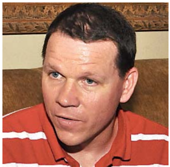
Sam Graves, congresista

PANAMÁ. Panamá ha encontrado un nuevo aliado en su lucha por lograr la ratificación del Tratado de Promoción Comercial (TPC) con Estados Unidos. Se trata del congresista republicano, Sam Graves, quien recientemente estuvo en Panamá para conocer de primera mano la realidad del país.