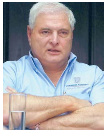
Martinelli visitará Colón hoy.

Hoy, que se celebran 106 años de la consolidación de la separación del Istmo en la ciudad costera, el presidente cuenta en una entrevista con La Estrella , que tiene para Colón, una ciudad sitiada por