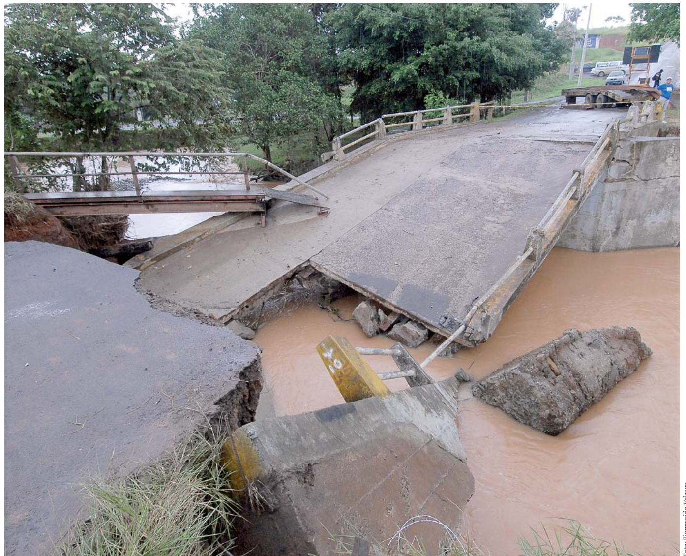
La reparación del puente puede durar al menos 15 días. Las comunidades afectadas deben viajar hasta 2 horas más para llegar a sus casas.

Ayer, unas cinco comunidades en La Chorrera quedaron aisladas cuando el puente Caño Quebrado colapsó ante la crecida del río Trapichito. Mientras en Soná unas 500 personas pudieron regresar a sus hogares luego que cediera el mal tiempo en el lugar. +4A