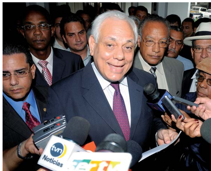
Se necesitan políticos que respeten a la opinión pública.

Miembros de distintos sectores se sumaron ayer a la protesta de La Estrella