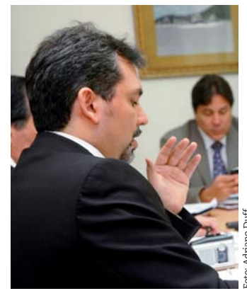
Los debates empezaron al mediodía.