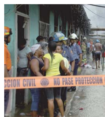
Camisas rojas no quieren intromisión.

Las diferencias tienen raíz en los recientes incendios, donde rescatistas y bomberos difieren en los procedimientos y se reclaman fallas. +6A