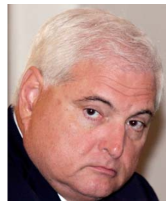
Presidente Ricardo Martinelli.