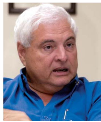
El presidente deplora el 'show'.