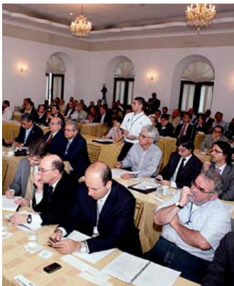
Interesados solicitaron cambios.