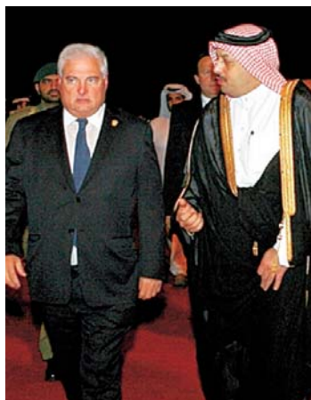
Martinelli llegó ayer a Qatar.