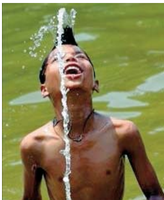
Ya se han alcanzado los 37 grados.

La razón es que por la posición de la tierra, los rayos solares caerán verticalmente en el país haciendo que el calor aumente. Se esperan temperaturas máximas. +9C