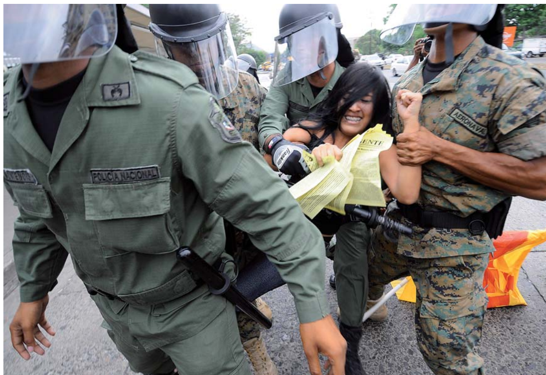
La Policía Nacional detuvo ayer a universitarios que cerraban la Transistmica.

Sectores populares intentan colocarse a la cabeza de la oposición. ¿El gobierno logrará mantener sus planes?