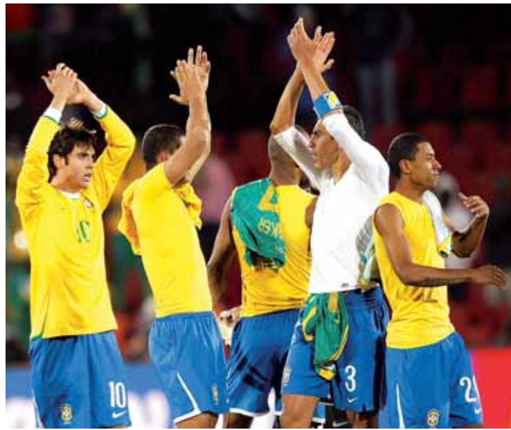
Brasil ha sido campeón en 1958, 1962, 1970, 1994 y 2002.

Detrás de los punteros, siguen Holanda, Italia y Alemania, y ya casi al límite de los 10 mejores Francia, para muchos conocedores, una sorpresa.