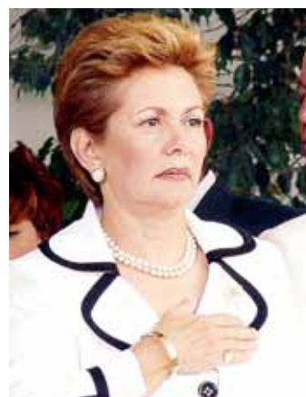
Mireya Moscoso, ex presidenta.

La versión del Ejecutivo establecía concesiones de te-