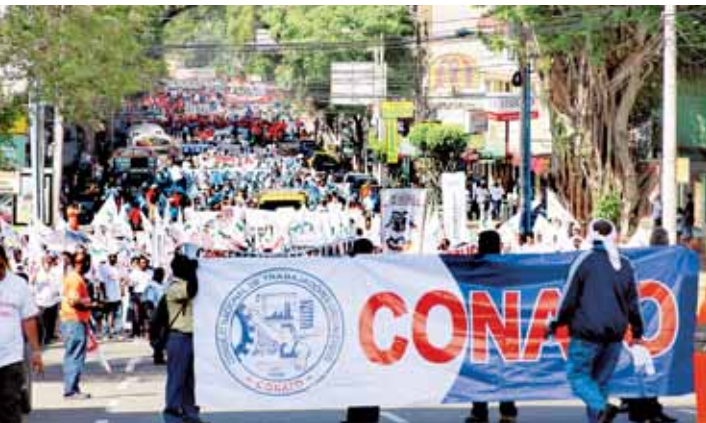
Los obreros aseguran que las reformas al código están ligadas a los TLC.

Ayer en la Asamblea Nacional el Frente por la Defensa de los Derechos Económicos y Sociales (Frenadeso), advirtió que están dispuestos a convocar una huelga si se aprueba